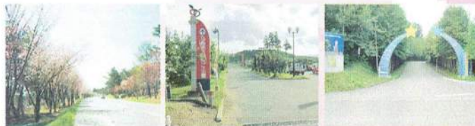
弘前桜並木 弘前りんご公園 星と森のロマンビア

弘前周辺には、特産のリンゴ公園、地元の米つがるロマン、星と森のロマンビア、有名なさくら並木などを楽しむことができます。