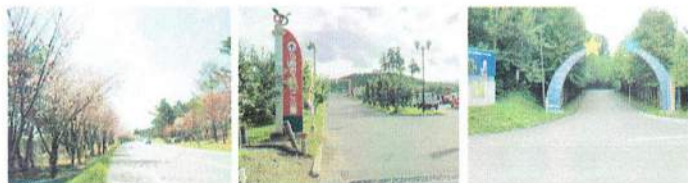
弘前桜並木 弘前りんご公園 ロマントピア

有名スポット 弘前周辺には、特産のリンゴ公園、地元のみつがるロマン、栗と森の ロマントピア、有名なきくら菓本などを楽しむことができます。